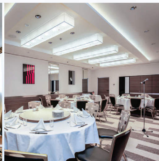
スペースシャトル(ロビー階)