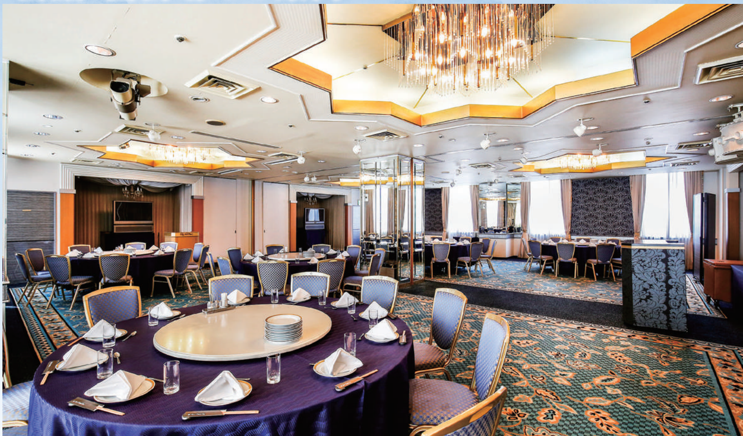
おおとり(ロビー階)