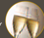
乾杯用スパークリングワインサービス